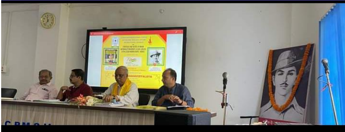
First Technical Session of Day 2 of the Seminar.