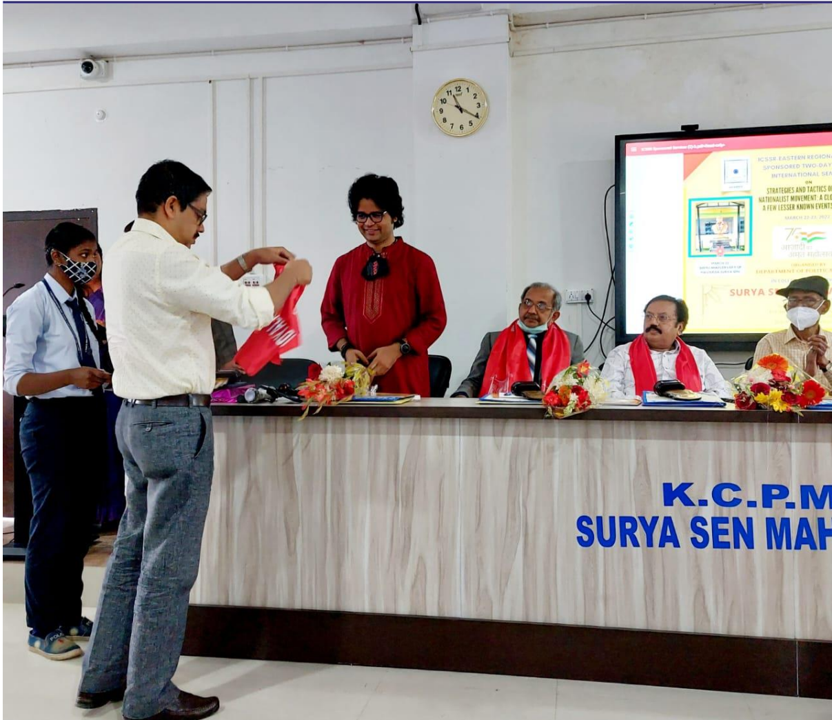
Felicitation of the Guest Speakers