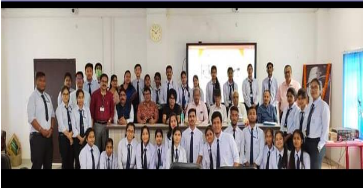
Students, some faculties with the invited guest speakers of the seminar