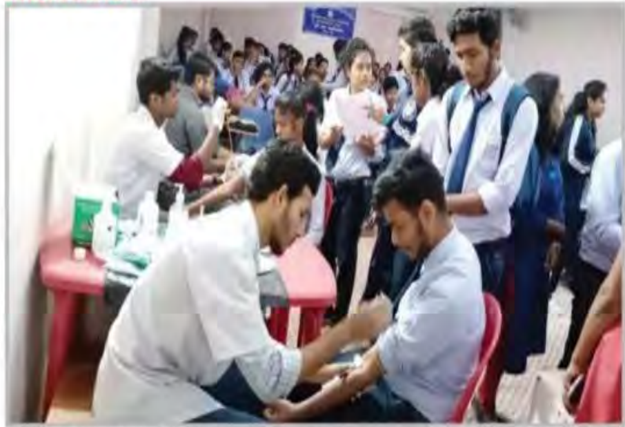
Surya Sen Mahavidyalaya, in collaboration with Siliguri Suryanagar Samaj Kalyan Sanstha and North Bengal Medical College and Hospital, organised a Thalassaemia awareness and free detection camp on the college premises in Siliguri on Friday.

Paper clip on Thalassaemi a awareness camp