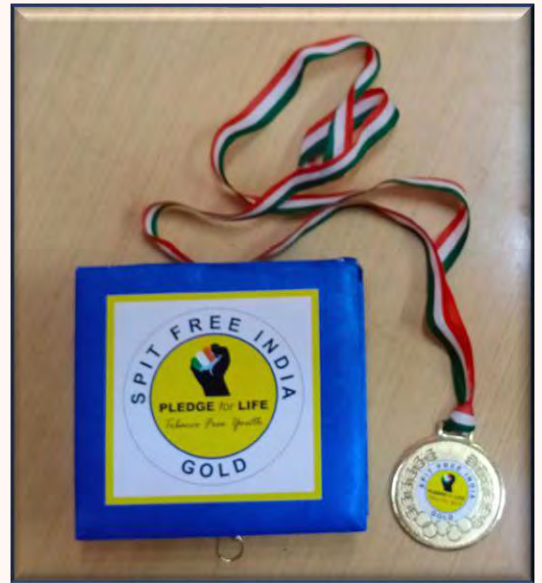
Two Gold Medals in Spit Free India Movement in the year 2020-2021