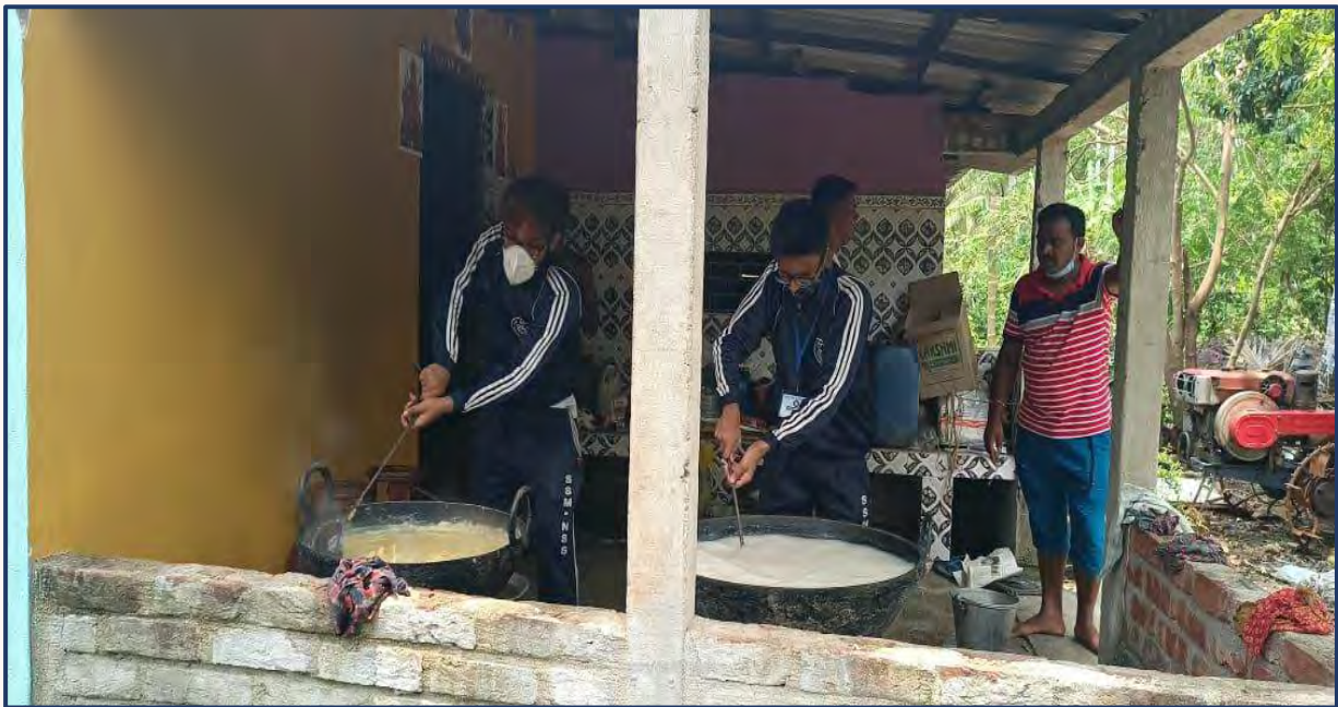
NSS Students volunteered in coastal areas of West Bengal devastated by YAAS cyclone from May 30 th to 7 th June 2021