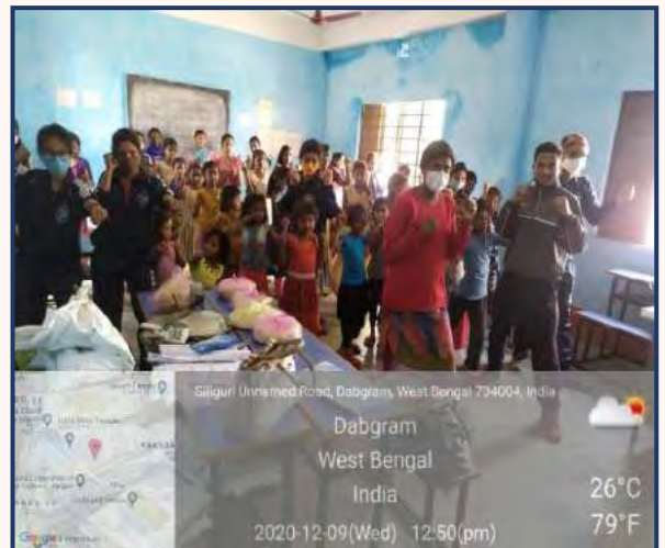
Provided self-defence training to girl students